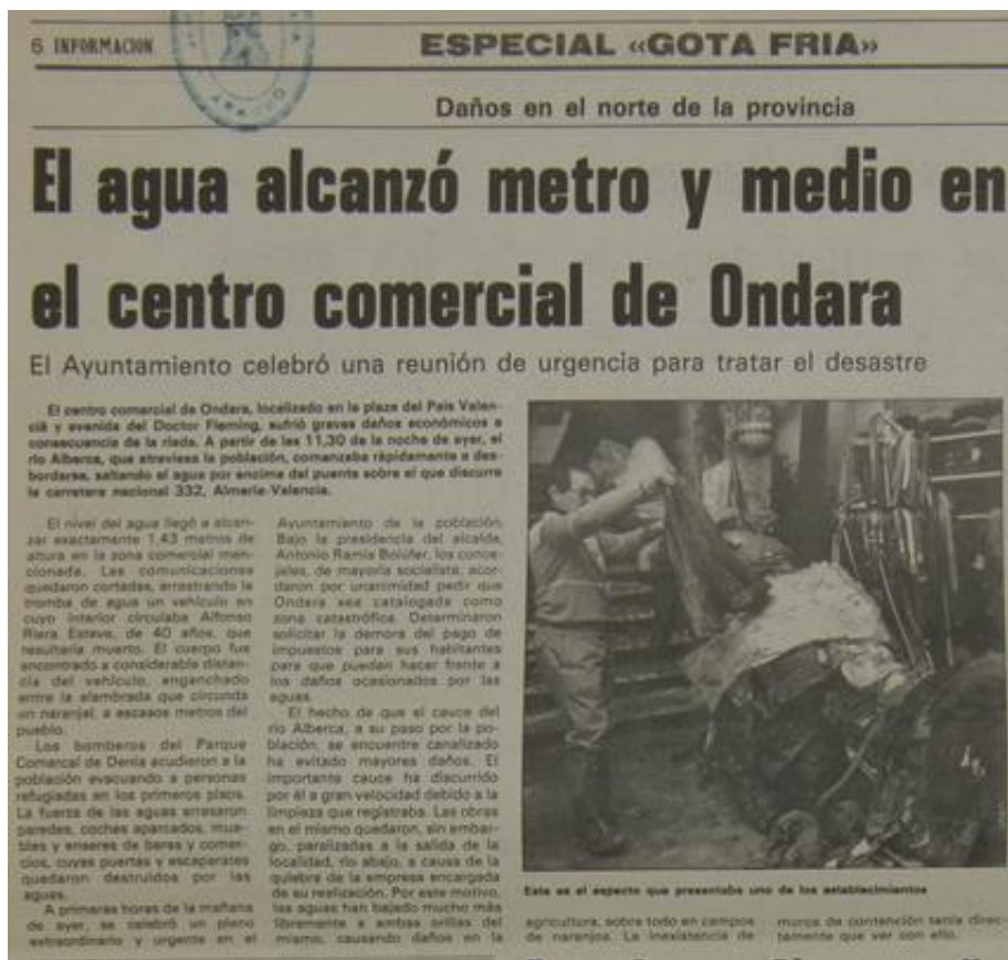
Imatge 8. Retall periodístic informant del succèit a Ondara. Diario Información de 17-11-1985.