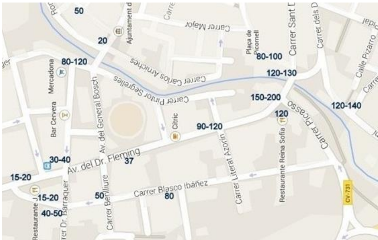
Imatge 5. Nivells assolits per l'aigua a la zona inundada. Elaboració pròpia.

A partir d'ací, i a mesura que ens allunyem de la primera zona citada, en direcció nord, l'aigua va anar laminant-se amb nivells entre 20 cm i 90 cm, exceptuant un tram del carrer Verger, el més pròxim al pont del Convent, que acumulava les aigües que baixaven per General Bosch, Dr. Barraquer, Soledat i el Verger, on la situació va ser bastant apurada. També al cul de sac o atzucac del carrer Virtuts es va produir un gran embossament d'aigua procedent dels punts alts del centre històric que no trobava eixida, per trobar-se tancat amb una paret, amb un sol i insuficient forat en la seua base, que donava a la séquia de les Alfatares, i que va provocar l'entrada d'aigua a les cases, fins que veïns i bombers tombaren la paret.