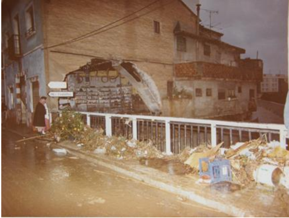
Imatge 7. Així va quedar la casa i el taller de motos i bicicletes de Felipe Solano.