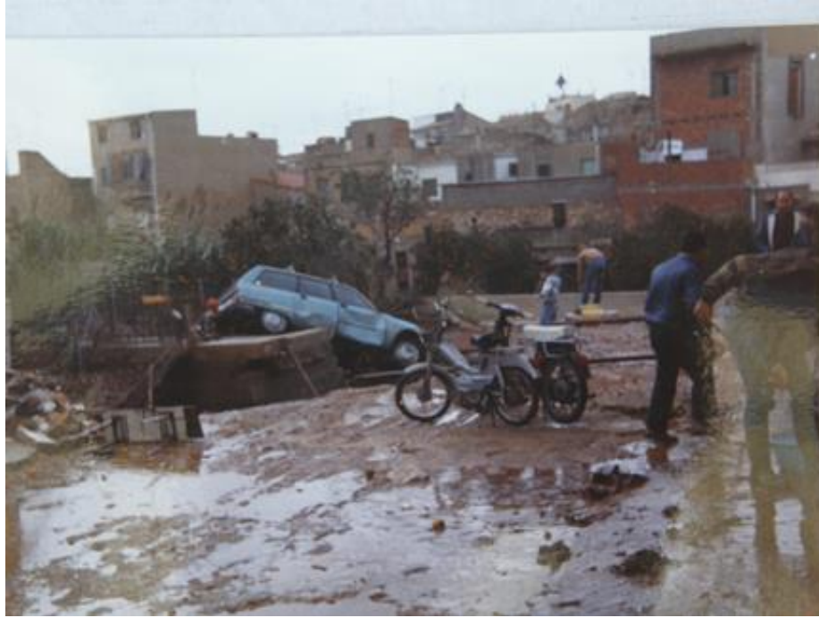
Imatge 9. Els danys en vehicles privats foren quantiosos.