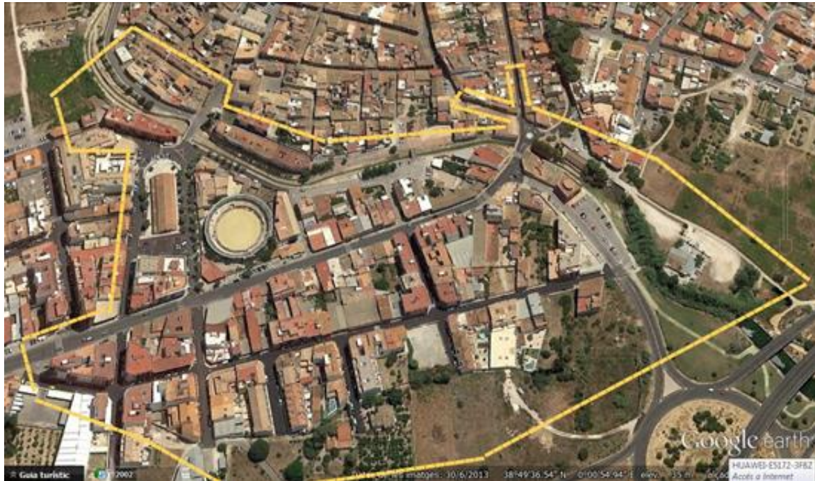
Imatge 4. Perímetre de l'àrea urbana inundada. Elaboració pròpia.

Així, la inundació va afectar a la ribera dreta de l'Alberca els carrers Camí Vell de la Llosa, Sant Doménec/Nou (fins els núm. 57-59), Escorxador, Serra (fins el núm. 22), Carlos Arniches, Virtuts i pl. del Convent. Per la banda esquerra, les aigües van inundar els carrers Picasso (CV-731), Blasco Ibáñez, Azorín, Consell, Parri, Mariano Benlliure, Dr. Barraquer, Palmera, el Verger, General Bosch, poeta Vicent Andrés Estellés, Pintor Segrelles, Dr. Fleming, Zurbarán, Marquesat de Guadalest i pl. del País Valencià. En total, al voltant de 80.000 m 2 de casc urbà.