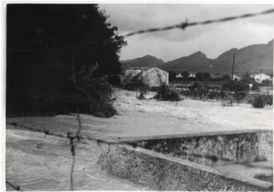
Imatge 2. Desbordament de l'Alberca el 29 de setembre de 1971.

De crescudes, desbordaments i inundacions, l'Alberca n'ha protagonitzat moltíssimes al llarg de la història. Res nou, tractant-se d'una rambla de règim mediterrani. Però solament quan els ondarencs ocupàrem manu militari per a les nostres necessitats la plana d'inundació de l'Alberca, incomplint la dita popular de «A la vora del riu, no faces niu», és quan començarem a tenir problemes seriosos. La memòria col·lectiva i els papers recullen la primera gran inundació protagonitzada per l'Alberca entre els dies 31 d'octubre i 1 de novembre de 1934 -uns, diuen que al migdia i, altres, que a la nit d'Ànimes-, causada per una precipitació de 147 mm, tot i que un testimoni afirma recordar que sobre Ondara no va caure ni una gota. Per fortuna, el grau d'ocupació urbana a ambdues vores del riu era aleshores escàs, amb pocs habitatges, entre ells el dels meus avis paterns –av. Dr. Fleming, 33-, concentrant-se els danys en la propietat agrícola, el pont del Convent i el rescat d'una persona, de malnom la Xufa , a la caseta del Mosquit, junt a l'Assut. Mon pare tenia llavors set anys i, ja major, em recordava la imatge dels mobles de casa surant en l'aigua que entrava per davant i per darrere de la casa (partida Parri); el tio Quico Frasés, que vivia just a la dreta del pont de Solano, va salvar la vida agafat a una estaca clavada a la paret, on lligava l'haca; i els veïns del carrer Virtuts hagueren de protegir les seues cases amuntgant alga davant dels portals.